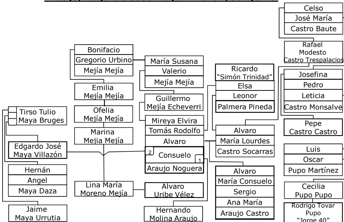
Diagrama No. 21.1.